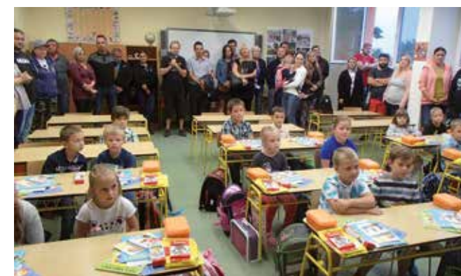
Slavnostní přivítání prvňáčků ve škole