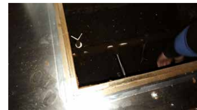
S vandalismem se bohužel potýkáme během celého roku. O letních prázdninách se navíc ještě zvyšuje.