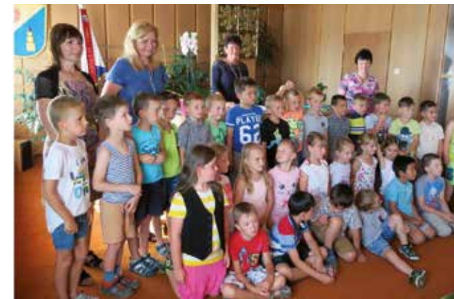
Slavnostní rozloučení s předškoláky na obecním úřadu městyse Ševětín